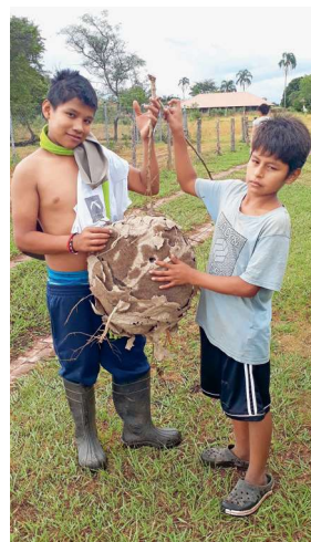
Wespennest – keine Weltkugel!