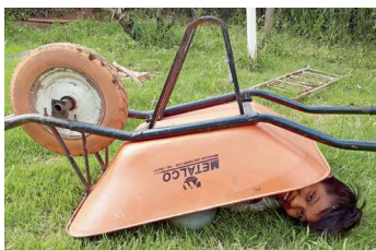
Cris denkt: «Lieber verstecken als helfen»!