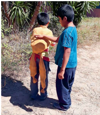
Pullover als «Zitronentransportmittel»!

Hier noch einige selbstredende Fotos unserer einfallreichen Jugend: